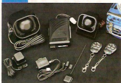
System1 クリフォード・インテリガード750J

乗り逃げを防止するブラックジャック機能、オムニセンサー、音感センサーも装備しており今の盗難の手法に対応。バックアップサイレン等も追加可能。工賃込み予算：21万円～