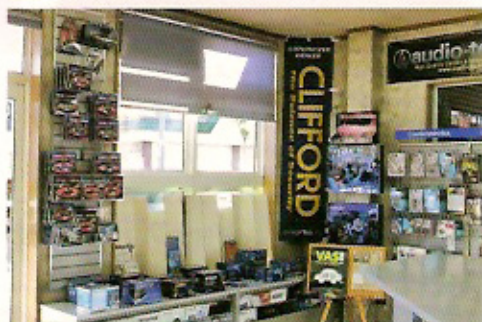
TMSGというカーセキュリティショップグループを結成しているジェットサウンド。ハイファイ系オーディオのインストールも得意分野だ

取り扱うバイパー、クリフォードのいずれかを問わずボンネットセンサーを標準でインストールするなど、カーセキュリティとしての機能に加えて、駐車環境や車種ごとの弱点をカバーし得る最適なシステムの構築を実現する。インストールに際し、バッテリーの消耗といった注意点からメリット、デメリットまでをこと細やかに説明することも忘れない。常に顧客にとって最良のカーセキュリティを提案しているのだ。